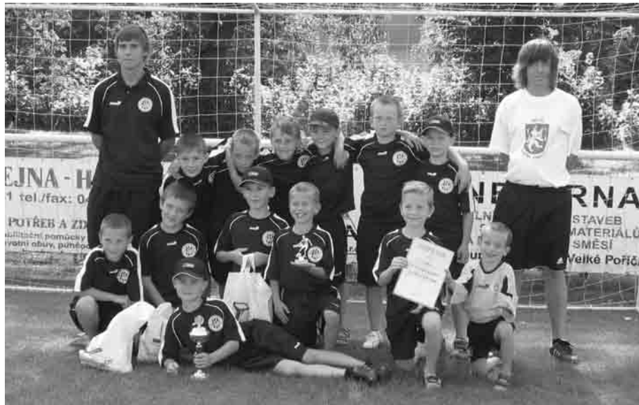
Mini (U-9) – vítězové turnaje Hašpl Cup 2008, Velké Poříčí.